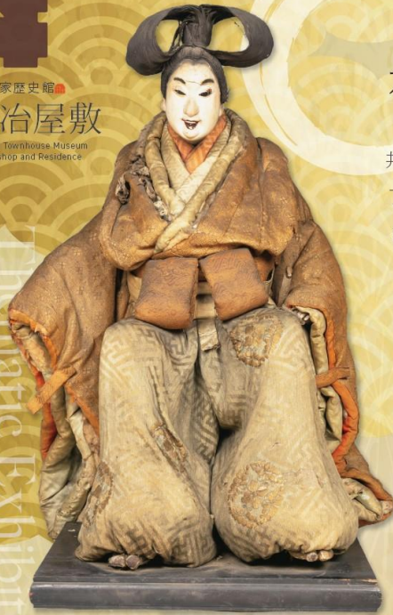
青龍鉾人形 / 文政7年作