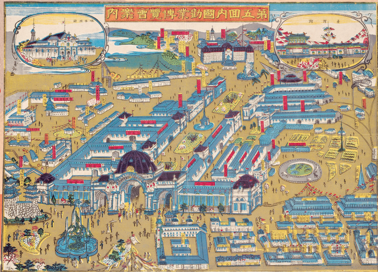
明治36年(1903)の第五回国内勸業博覧会案内(堺市立中央図書館蔵)