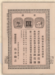
博覧会賞牌受領広告 醸造発売所 鳥井駒吉