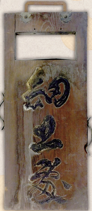
初公開 細工処看板