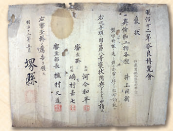
初公開 明治12年(1879)奈良博覧会褒状 (第8等、真鍮細工物各種)